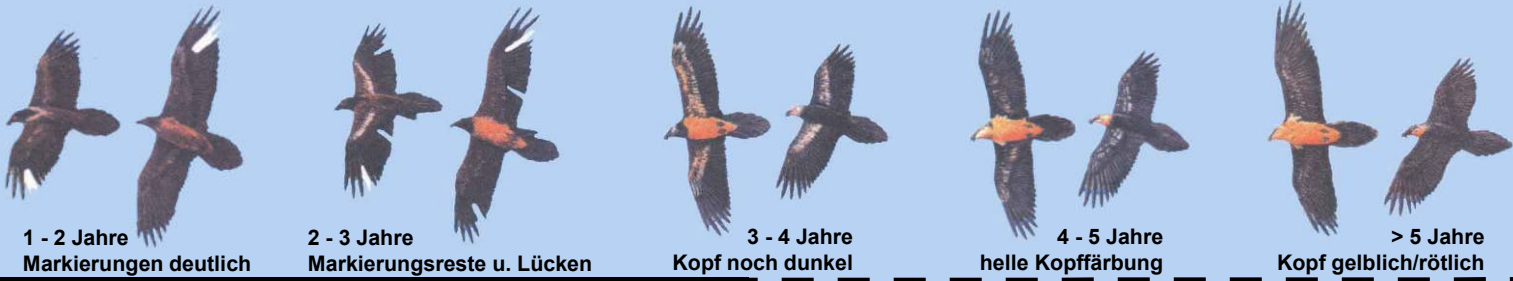
1 - 2 Jahre Markierungen deutlich

Grafiken: El Quebrantahuesos en los Pireneos (R. Heredia y B. Heredia); Ministerio de Agricultura Pesca y Alimentación. Publicaciones del Instituto Nacional para la Conservación de la Naturaleza, 1991