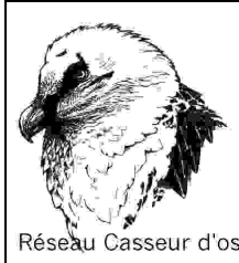
Réseau Casseur d'os